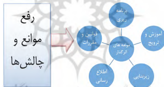
شکل ۱. مدل مفهومی تحقیق

پس از گردآوری مبانی نظری و پیشینه پژوهش بر مبنای موضوع مورد مطالعه مدل نظری زیر تهیه گردید.