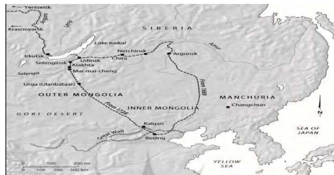
شکل (۳): راه شمالی میان چین و روسیه

با چین به تاتارها یعنی اردوی سفید و دشت جُته (که بعداً سیبری نامیده شد) وابسته بود (Mazaheri, 2009: 2,906) ۱