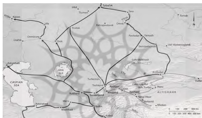
شکل (۲): شبکه‌های ارتباطی بازرگانان بخارائی و اندیجانی

مستقل (خوقند و خیوه) در آسیای مرکزی موجب تکاپوهای جدید در شبکه‌های نوین تجارت زمینی شدند. روس‌ها با ساخت قلعه در مسیر خوقند ۱ و افتتاح راه آبی از دریای آرال به سمت مناطق علیای رودخانه‌های سیردریا و آمودریا سعی در گسترش مسیرهای ارتباطی داشتند (Ghafurov, 1997: 987-8). ۲ در بخش غربی نیز شبکه تجارت زمینی از طریق خوارزم به دشت‌های پونیک و روسیه متصل می‌شد؛ به همین دلیل در دوران جدید نقش کلیدی خوارزم با سیاست‌های گسترش محور روسیه اهمیت بیشتری می‌توانست دریافت کند (Soucek, 2019: 220; Ghafurof, 1997: 950).