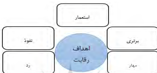
شکل (۱): اهداف رقابت از منظر ژئوپلیتیک

در حال حاضر یا به بروز موازنه‌های صلح پرور منجر شود، مانند رقابت‌های قدرت‌های شرقی و غربی در دوران رقابت‌های ژئوپلیتیک دوقطبی و یا به تعامل و همکاری میان قدرت‌ها بیانجامد، مانند تعامل و همکاری روسیه و بریتانیا در ابتدای قرن بیستم در خصوص روسیه.