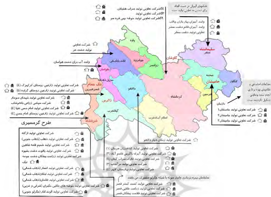
شکل ۲. وضعیت انبار و ساختمان‌های احداثی بهره‌برداری شبکه‌های آبیاری تحت پوشش تعاونی‌های تولید در استان کرمانشاه

مطالعه پیش‌رو به‌منظور شناخت عوامل مثبت و منفی در مدیریت بهره‌برداری از شبکه‌های آبیاری استان کرمانشاه و با استفاده از روش‌های ارزیابی مشارکتی روستایی PRA و همچنین مدل SWOT انجام شد. PRA نشان دهنده گروهی از رویکردها و روش‌هایی است که جامعه یک روستا را ترغیب می‌کند تا ضمن بالا بردن دانش خود، فعالانه در تجزیه و تحلیل مسائل و مشکلات جامعه خود مشارکت کنند. استفاده از تجربیات جامعه به‌ویژه طبقه حاشیه‌ای مانند زنان، کشاورزان و کودکان در تسهیل توسعه بسیار مهم است و باید به نظرات آن‌ها گوش داد و شکایات، تجربیات زندگی، امیدها و توانایی‌های تجزیه و تحلیل آن‌ها را شنید. این امر در خلال جلسات و گردهمایی‌های انجام شده در روستاهای محدوده مطالعاتی بعد از گفتگوهای مفصل و طولانی و ارائه توضیحات از سوی تسهیلگران اجتماعی پروژه احداث شبکه فرعی آبیاری انجام شد.