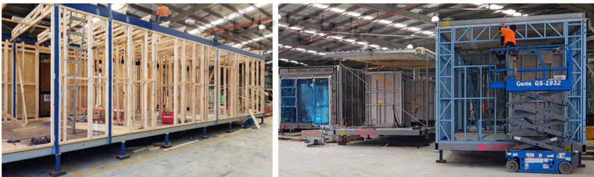
شکل شماره ۱. ساخت مدول‌های پیش‌ساخته در کارخانه [۳۵]