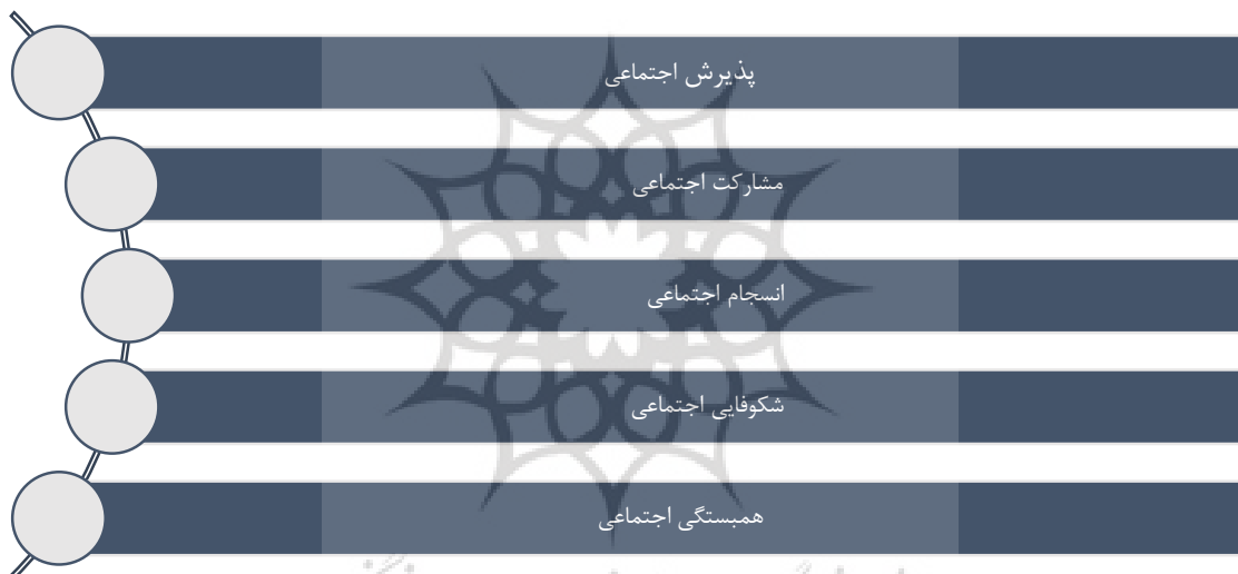
شکل ۱: ابعاد سلامت اجتماعی [۳]

وضعیت نامطلوبی از سطح کیفیت زندگی و رفاه عمومی شهروندی را به بار آورده است. امروزه روند شهرنشینی به وجود آمده به دنبال برخی ویژگی‌های مسائل ناسازگار شهری از جمله کیفیت هوا، بیماری‌ها، افسردگی‌ها، سطح فعالیت‌های بدنی و...، برنامه‌ریزان و دست‌اندرکاران را بر آن ساخت تا در خصوص ایجاد و توسعه فضاهای شهری مبتنی بر سلامت توجه و تأکید مضاعفی را مقبول نمایند. لذا، در اهداف برنامه ریزی و مدیریت شهری که از سوی سازمان ملل ارائه شده است، دسترسی جهانی به فضاهای امن، فراگیر و در دسترس بودن فضای سبز و عمومی برای زنان