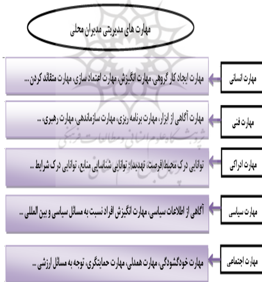
شکل ۱: مدل مفهومی تحقیق

طرح‌های هادی روستا، حسابداری برای تدوین بودجه و نظارت بر هزینه کرد دهیاری‌ها و برنامه‌ریزی روستایی برای تدوین برنامه‌های توسعه روستا است [۷]. البته مدیران محلی از این نوع مهارت بندرت به‌صورت کامل برخوردارند و نمی‌توان گفت که به‌طورقطع همه آنان از این نوع مهارت برخوردارند. مهارت ادراکی نیز از آن دسته از مهارت‌هایی است که به توانایی‌های شناختی و ادراکی مدیران از مجموعه‌ای که در آن فعالیت می‌کنند اشاره دارد. دستیابی به این نوع مهارت چارچوب کلی از مدیریت روستایی و شناخت مشکلات مدیریت را در عرصه روستا، برای مدیران نمایان می‌سازد و راهکارهایی برای تحقق اهداف مدیریتی و برطرف کردن مشکلات در این زمینه برای مدیران محلی ارائه می‌دهد مانند: درک محیط (فرصت و تهدید در سطح روستا)، توانایی درک شرایط روستاییان در ابعاد مختلف، قدرت