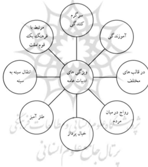
شکل ۱. ویژگی‌های ادبیات عامه

دارای اقسام و انواع مختلفی است. تقریباً همه مردمان شناخته شده، اکنون یا در گذشته، آن را تولید کرده‌اند. تا حدود چهار هزار سال قبل از میلاد، همه ادبیات شفاهی بود. اشکال عمده ادبیات عامیانه عبارت‌اند از: آهنگ‌های محلی، تصنیف‌ها، نمایش عامیانه، افسانه‌ها و دیگر مانده‌ها. همچنین، ادبیات عامه در مناطق مختلف جغرافیایی دارای عناوینی متفاوت است: (آسانو (دامغان)، اوسنه (خراسان)، آسوک (سیستان)، آسونک (دماوند)، سَنگ (خارک)، مِیل (بویراحمدی)، اُستونیه، (بویین‌زهره)، پاچا (کرمانشاه)، و چیرگ (کردی) (آذرلی، ۱۳۸۷، صص. ۵، ۲۹، ۶۹، ۱۵۴، ۲۲۸، ۳۵۶). (۴۰۳).