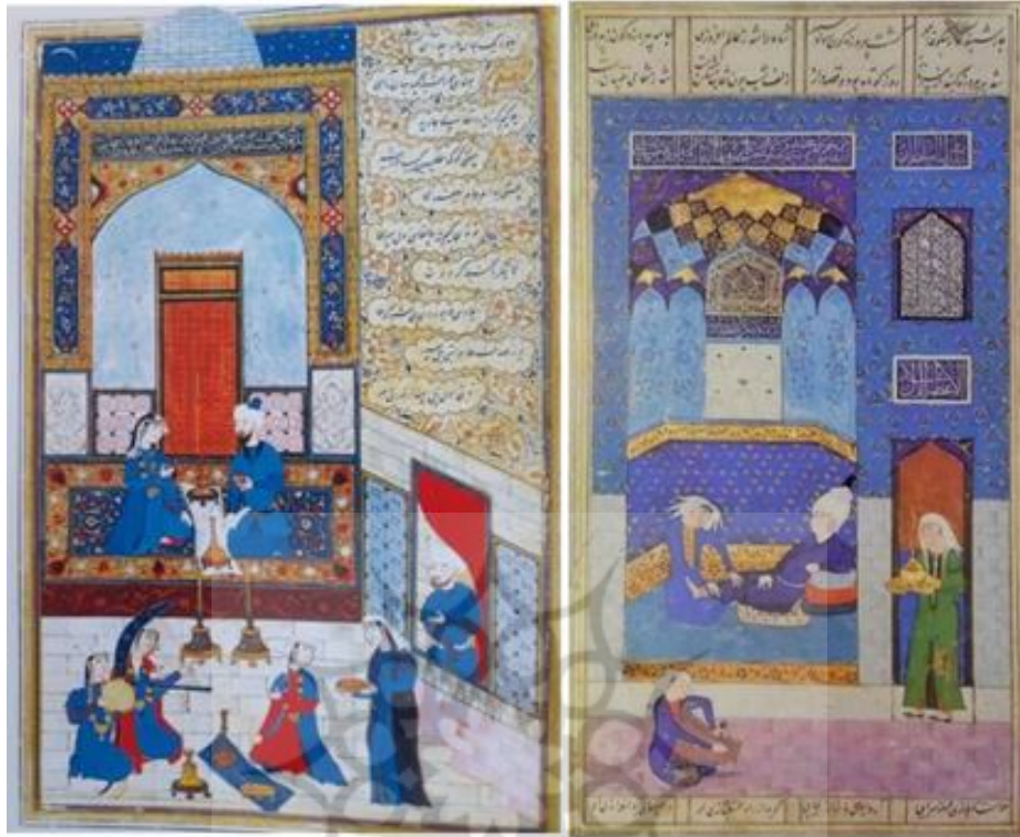
تصویر ۲. گنبد فیروزه‌ای (فلامکی، ۱۳۹۱، ص. ۵۳۱) Pic. 2. Turquoise dome (Felamaki, 2012, p. 531)