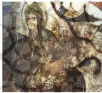
تصویر ۸: نقاشی بقاع متبرکه، بقعه چهار پادشاه (نگارنده، ۱۴۰۲)

تصویر شماره ۸ متعلق به نقاشی‌های بقاع متبرکه گیلان است. در این دیوارنگاره ابوالفضل (ع) سوار بر اسبی قهوه‌ای‌رنگ، در حال تاخت به سمت میدان نبرد نمایانده شده، چهره ایشان به سبک نقاشی‌های ایرانی (چشمان درشت، لبان کوچک و ابروان پیوسته)، نقاشی شده است. جزئیات لباس، زره، اسب، و چهره ایشان نسبت به سایر نقاشی‌های بقاع دقیق‌تر است. در تصویر شماره ۹، ابوالفضل (ع) سمت چپ تصویر تمام‌قد ایستاده است، از اسب خبری نیست، کلاه‌خود مزین به دو پر بر سر دارد و در حال جنگ تن به تن است؛ حریف خود را با شمشیر از وسط به دو نیم تقسیم کرده است. الگوی چهره‌پردازی ایشان شبیه تصویر شماره ۸ است.