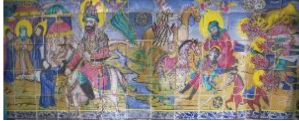
تصویر ۲: نقاشی بقاع متبرکه گیلان، بقعه سید حسین - سیدابراهیم (نگارندگان)