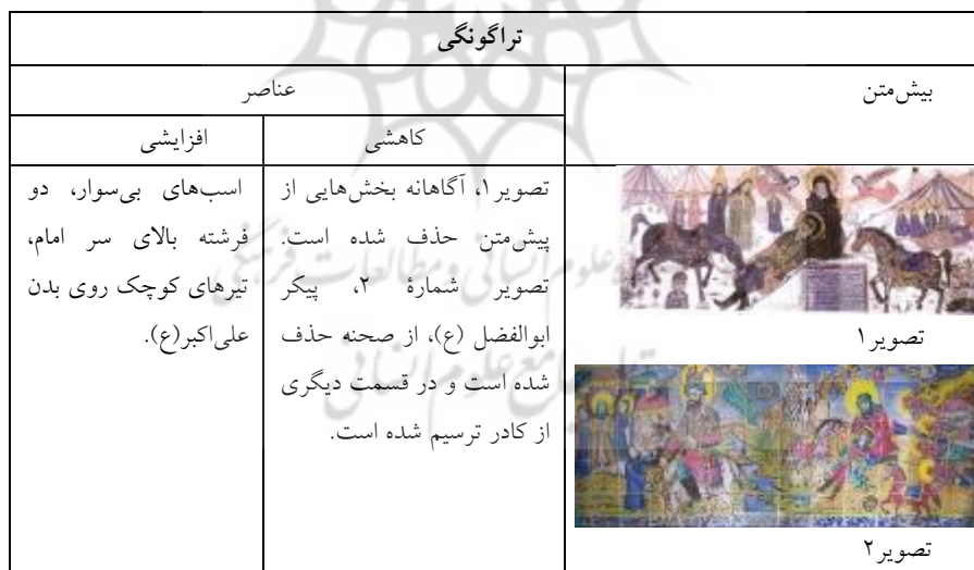
Table2: Transformation (Transposition) in Guilan's holy shrine paintings

جدول ۲: تراگونگی از نوع جای‌گشت در نقاشی‌های بقاع متبرکه گیلان (نگارندگان، ۱۴۰۲)