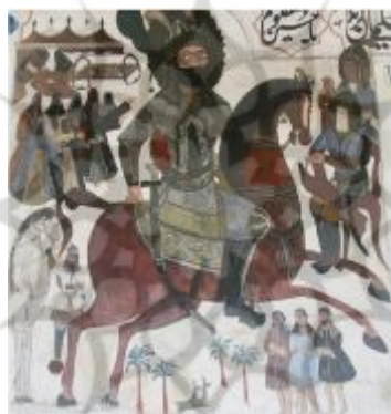
تصویر ۱۲: نقاشی پشت شیشه (سلحشور و کازرونی، ۱۳۸۷، ص. ۱۱۹)