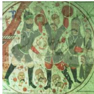
تصویر ۹: نقاشی بقاع متبرکه، بقعه سید رضا داور کیا (نگارندگان، ۱۴۰۲)