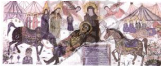
تصویر ۱: نقاشی بقاع متبرکه گیلان، بقعه قادر پیغمبر، باباولی، دیلمان (آقاخانی و منتظری، ۱۳۸۸، ص. ۲۴۱)

خوانش ترامنتی نقاشی بقاع متبرکه گیلان و نقاشی... منیر صحت قول فرد و همکاران بزرگ برای نقاشی فراهم نگردد، دوم اینکه آثار پشت شیشه در قدیم به وسیله درویش دوره گرد مورد استفاده قرار می گرفت و از این رو قابلیت حمل و نقل آن بسیار مهم به نظر می رسید و این عمل در صورت کوچک بودن ابعاد شیشه میسر بود (افشاری، ۱۳۸۶، ص. ۳۰). در گیلان تعداد زیادی بقعه و جود دارد که دیوارهای آن پوشیده از تصویرسازی های وقایع کربلا است. تصاویر بقاع گیلان، عموماً چند لایه هستند. با برداشتن لایه های رویی به لایه های زیرینی برمی خوریم که قدمت آن به زمان صفویه می رسد (محمودی نژاد، ۱۳۸۸، ص. ۲۷). نظر به اینکه حداقل یکی از لایه های نقاشی بقاع به عهد صفوی مربوط است پس این نقاشی ها در اواخر دوره صفوی وجود داشته داشته، ولی چون بیشترین آثار در اواخر عهد قاجار پدید آمده است، اوج آن در حدود یک صد سال پیش، مقارن با انقلاب مشروطیت بوده است (شایسته فر، ۱۳۸۷، ص. ۱۱).