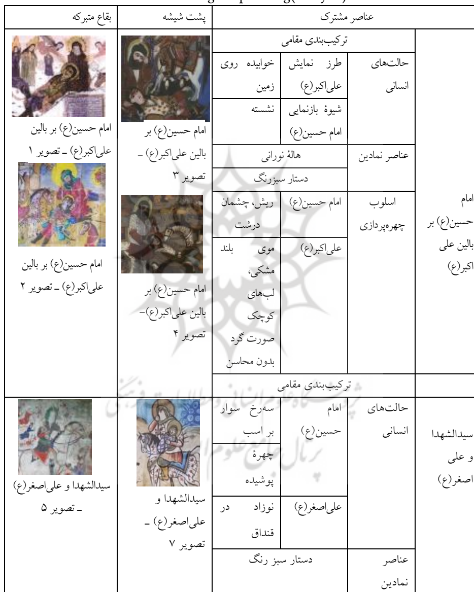
Table1: Hypertextual Equality (forgery) in Guilan's holy shrine paintings and Under-glass painting(Essayist)