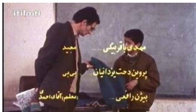
تصویر شماره ۱۱