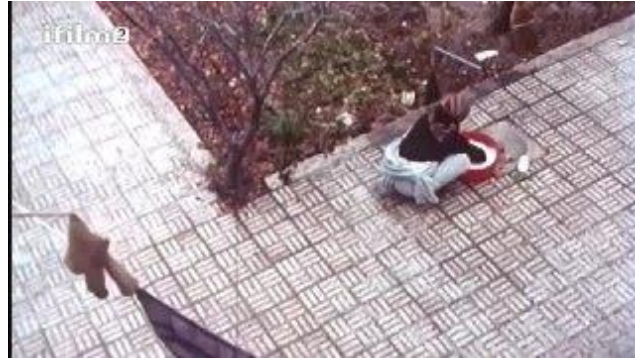
تصویر شماره ۸