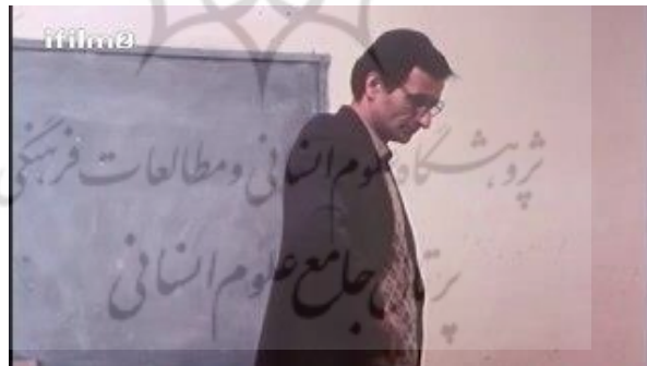
تصویر شماره ۱۰