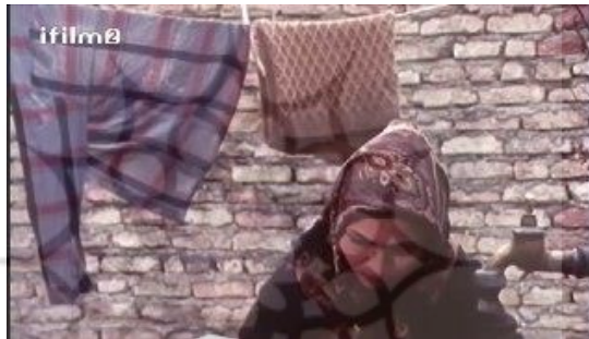
تصویر شماره ۹