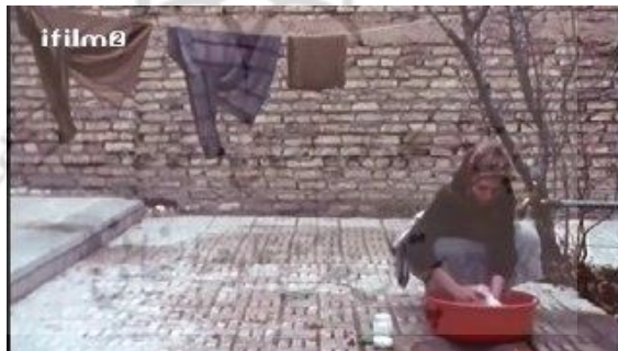
تصویر شماره ۷