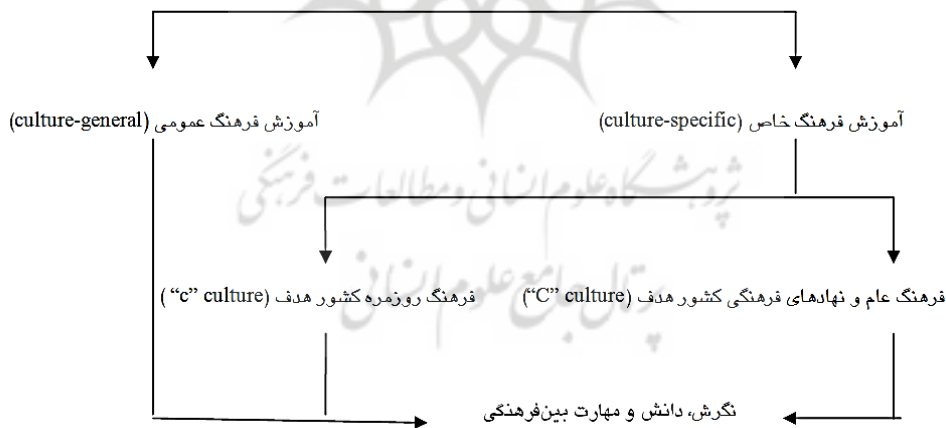
شکل ۱: آموزش فرهنگ به دانشجویان خارجی