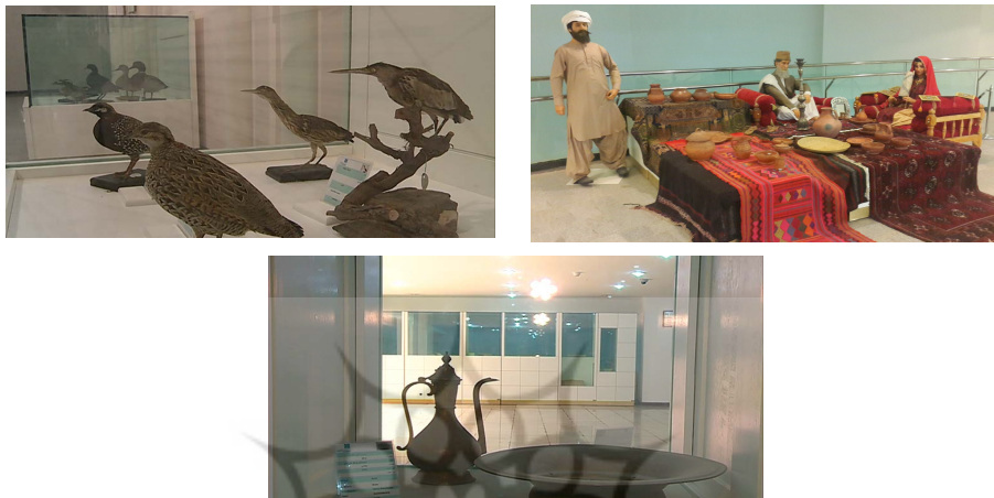
Figure 2- A view of the largest museum in the southeast of Iran

بخش‌های جانبی موزه شامل؛ رمپ، آکواریوم، کتابخانه، واحد اسناد و مدارک، سالن نمایش، تالار محققین جهت فعالیت‌های پژوهشی و تحقیقاتی، تالار رایانه، کارگاه‌های آموزشی، فنی، اتاق ساخت مولاژ، اتاق مرمت اشیاء، مخزن، عکاس‌خانه، سالن اجتماعات، کلاس‌های آموزشی، فضاهای اداری و سن رو باز با ظرفیت ۱۵۰ نفر است (سازمان میراث فرهنگی استان سیستان و بلوچستان، ۱۴۰۲).