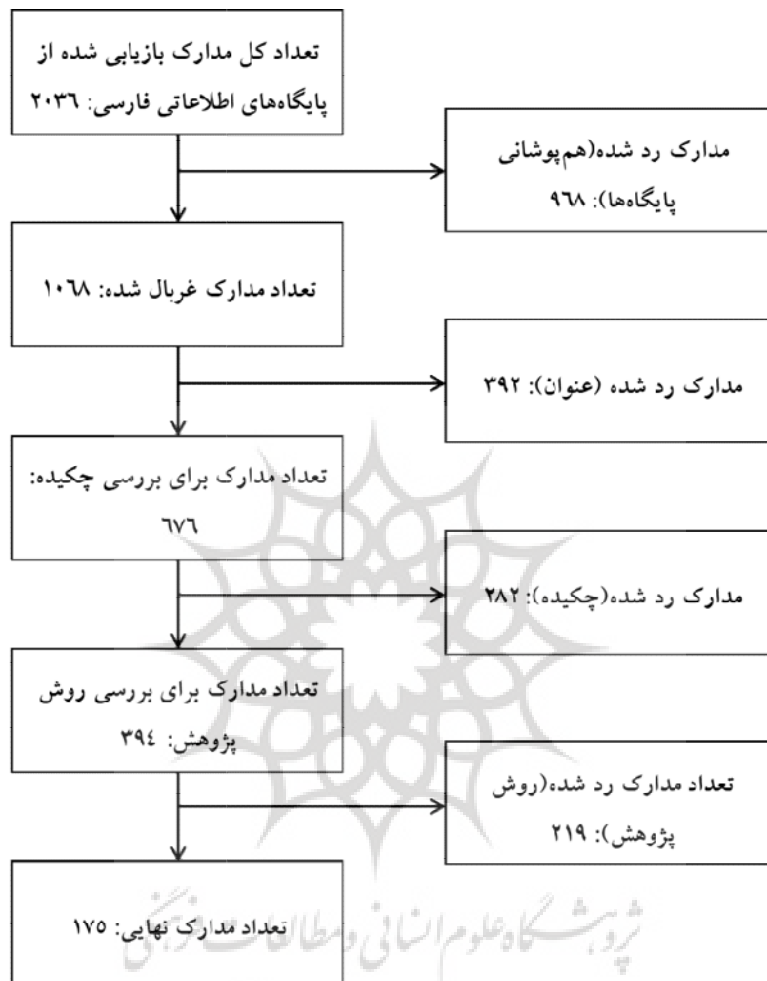
شکل ۲. الگوریتم انتخاب مدارک مناسب جهت تحلیل

همان‌طور که در شکل ۲ نمایان است، از مجموع ۲۰۳۶ منبع بازیابی شده تعداد ۱۰۶۸ منبع بعد از حذف مدارک هم‌پوشانی بین پایگاه‌ها به دست آمد که سپس در مراحل غربال‌گری، عنوان‌ها، منابع، چکیده منابع و در نهایت روش پژوهش منابع به ترتیب تعداد منابع از ۱۰۶۸ به