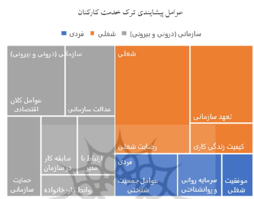
شکل ۳. مدل مفهومی پژوهش: مؤلفه‌های ترک خدمت کارکنان با تأکید بر عوامل پیشایندهی