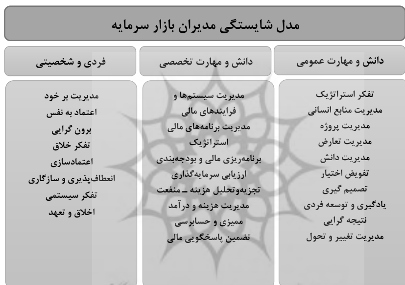
شکل ۱. مدل شاخص‌های شایستگی مدیران بازار سرمایه

۰/۷۳۰ می‌باشد. همانطور که نتایج آزمون برای ابعاد نشان می‌دهد سطح معناداری (sig) در تمامی متغیرها کمتر از ۰/۰۵ است. این نشان می‌دهد که توزیع نرمال نمی‌باشد. یعنی بین تابع توزیع تجمعی مشاهده‌شده و نظری تفاوت وجود دارد. نتایج آزمون برای مولفه‌ها نیز نشان می‌دهد که سطح معنی‌داری برای متغیرهای سوم و هفدهم بیش از ۰/۰۵ و برای متغیرهای دیگر کمتر از ۰/۰۵ می‌باشد. در ادامه تعیین درجه اهمیت ابعاد و مولفه‌های مدل به کمک آزمون تک‌تک نمونه‌ای انجام گرفته که در این آزمون، فرض بر این است نمونه‌ای با حجم n و میانگین m از یک جامعه انتخاب شده که این نمونه یک نمونه تصادفی از جامعه-ای با میانگین \mu است. در این آزمون باید توزیع داده‌ها به صورت نرمال باشد و یا اینکه تعداد نمونه‌ها زیاد باشد تا بتوان آن را نرمال فرض کرد. با توجه به اینکه در این پژوهش تعداد خبره‌ها (نمونه‌ها) ۳۰ می‌باشد پس می‌توان از آزمون t استفاده کرد. مطابق جدول (۹) و (۱۰)، میانگین تمامی ابعاد و مولفه‌ها بیشتر میانه مولفه‌ها (عدد ۳) است. سطح معنی‌داری برای تمام ابعاد و مولفه‌ها کوچک‌تر از ۰/۰۵ است. یعنی میانگین ابعاد و مولفه‌ها به صورت معناداری از عدد ۳ بزرگ‌تر است و به عبارت دیگر از دید خبرگان تمام ابعاد و مولفه‌های معرفی شده از اهمیت بالایی برخوردارند. بر این اساس پس از مطالعه ادبیات، تجزیه و تحلیل آماری، مدل شامل سه بعد و ۲۶ مؤلفه برای شایستگی مدیران بازار سرمایه بدست آمده که در شکل (۱) نشان داده شده است.