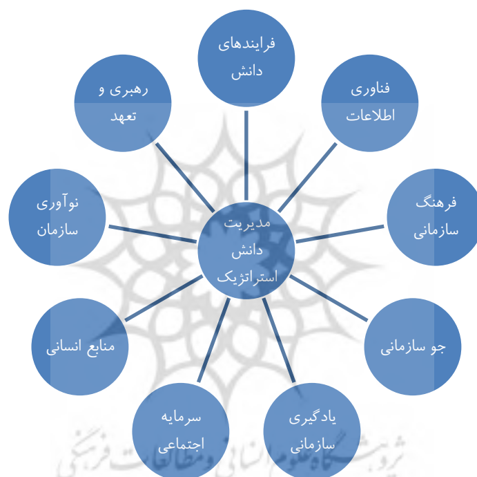
نمودار ۱: مدل مفهومی پژوهش

در ادامه این سؤال مطرح می‌شود که شناسایی و اولویت‌بندی عوامل مؤثر بر استقرار سیستم مدیریت دانش استراتژیک در دانشگاه پیام نور غرب کشور با روش AHP به چه صورت است؟ در این راستا با بررسی پیشینه پژوهش و نظر خبرگان، عوامل اصلی اصلی در دانشگاه پیام نور استخراج و در نه گروه اصلی که شامل: فرایندهای دانش، فناوری اطلاعات، فرهنگ سازمانی، جو سازمانی، یادگیری سازمانی، سرمایه اجتماعی، منابع انسانی، نوآوری سازمان، رهبری و تعهد، بود به عنوان متغیرهای مستقل این پژوهش شامل شناسایی شد و متغیر وابسته، مدیریت دانش استراتژیک می‌باشد.