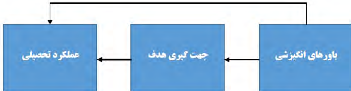
نمودار ۱: نمودار مفهومی پژوهش

ارائه شده است. در این مدل؛ باورهای انگیزشی (خودکارآمدی، ارزشگذاری درونی و اضطراب امتحان) به عنوان متغیرهای برون زاء، انواع جهت گیری هدف (اهداف تسلط گرایی، تسلط اجتنابی، عملکرد گرایی و عملکرد اجتنابی) به عنوان متغیرهای واسطه و عملکرد تحصیلی به عنوان متغیر درونزا در نظر گرفته شده است.