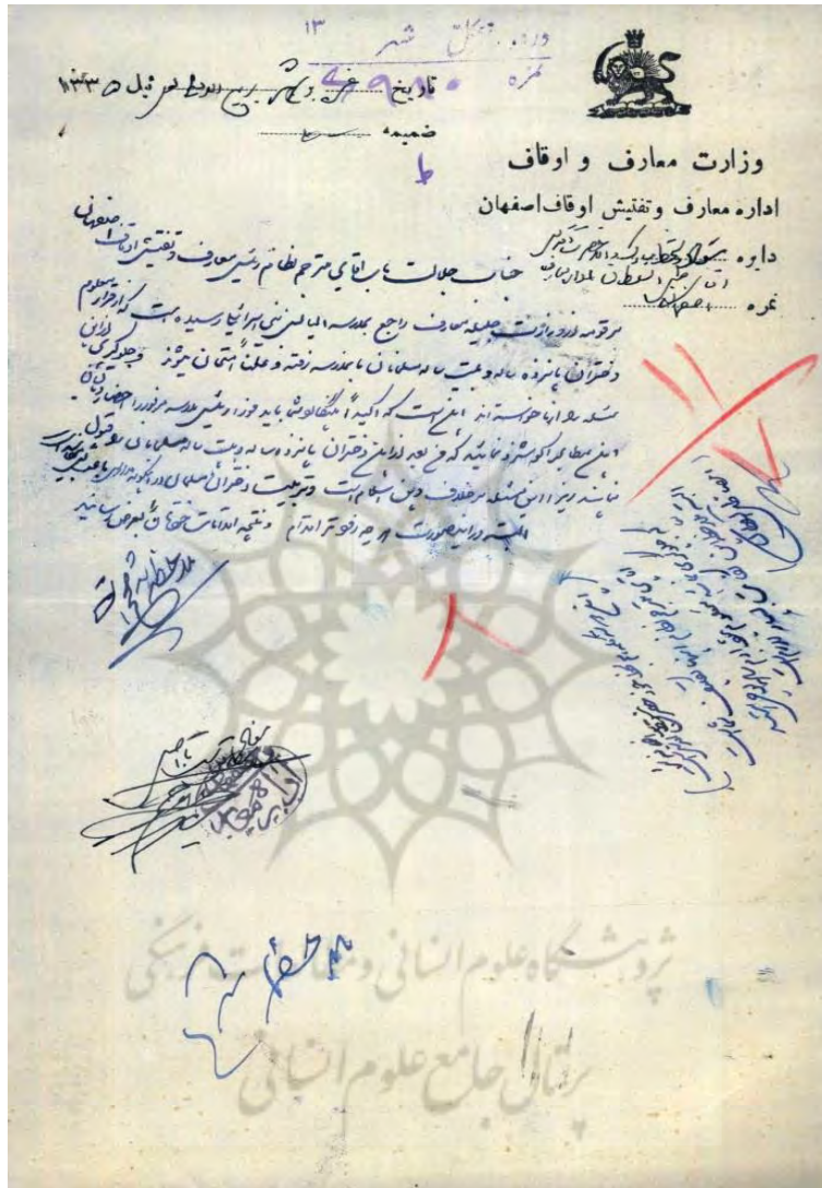
رونوشت حکم ظل السلطان درباره ممنوعیت تحصیل دختران بزرگسال در مدارس خارجی