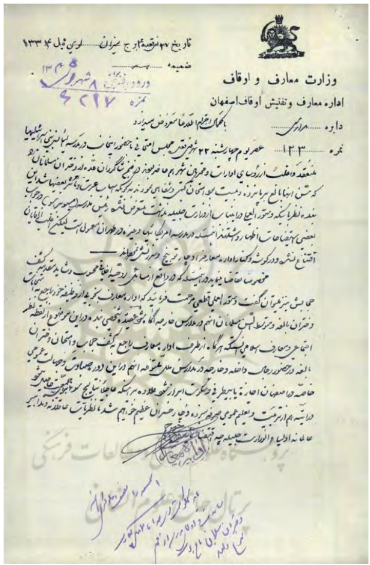
گزارش رئیس معارف اصفهان به تهران دربارهٔ مدرسه آلیانس