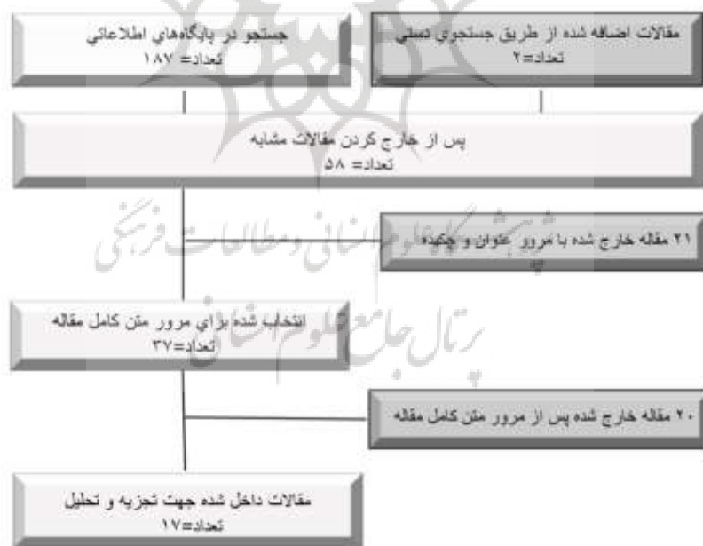
شکل ۱. چارت انتخاب مقالات

بر اساس استراتژی جستجو ۱۸۹ مقاله به دست آمد که به طور نظام‌مند از نظر مرتبط بودن بر اساس عناوین و چکیده‌ها بررسی شدند. در پایگاه‌های داخلی مقاله‌ای که به سؤال پژوهش پرداخته باشد، یافت نشد. فقط مطالعاتی که معیارهای ورود و خروج را داشتند حفظ شدند. علاوه بر این، برای اطمینان از اینکه مطالعات دارای دقت روش‌شناختی کافی هستند، تنها مطالعاتی که در مجلات معتبر منتشر شده بودند در نظر گرفته شدند. غربال‌گری مقالات در دو مرحله انجام شد. ابتدا در پایگاه‌های اطلاعاتی مذکور مقالاتی که به زبان غیر انگلیسی بودند، مقالاتی که قبل از سال ۲۰۰۰ منتشر شده بودند و مطالعاتی که مقاله علمی - پژوهشی نبودند، از لیست خارج شدند. در مرحله دوم غربال‌گری پس از حذف موارد تکراری، ابتدا عنوان و چکیده مقالات با دقت مطالعه و مقالات غیر مرتبط حذف شدند، ۳۷ مقاله برای بررسی متن کامل باقی ماند. در مرحله نهایی پالایش، مقالاتی که به مباحثی غیر از ویژگی‌های دانشجویی ایده آل پرداخته بودند و همسو با هدف این پژوهش نبودند از مطالعه خارج شدند و ۱۷ مقاله تمام متن برای تحلیل نهایی شناسایی شد.