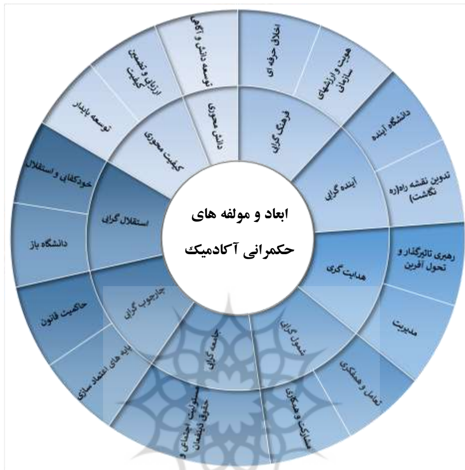
شکل ۲- مدل مفهومی حکمرانی آکادمیک (حاصل فراترکیب)

در این مدل ابعاد حکمرانی آکادمیک عبارت‌اند از: استقلال‌گرایی، چارچوب‌گرایی، جامعه‌گرایی، شمول‌گرایی، هدایت‌گری، آینده‌گرایی، فرهنگ‌گرایی، کیفیت‌محوری و دانش‌محوری.