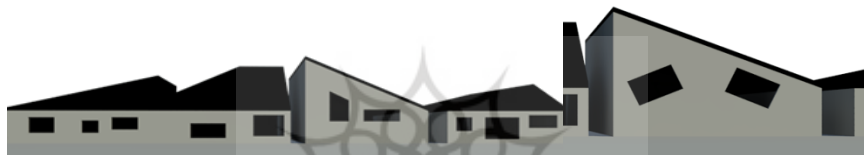
شکل ۱. شبیه‌سازی خانه‌ها و پنجره‌ها در داستان بوف‌کور

پنجره‌ها به چشم‌های گیج کسی که تب‌هذیانی داشته باشد شبیه بود... (هدایت، ۱۳۵۶: ۳۴). خانه‌های عجیب و غریب به شکل‌های بریده‌بریده هندسی با پنجره‌های متروک سیاه، کنار جاده رج کشیده بودند، ولی بدنه دیوار این خلنه مانند کرم شبتاب تشعشع کدر و ناخوشایندی از خود متصاعد می‌کرد... (همان، ۴۱).