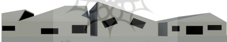
شکل ۳. شبیه‌سازی خانه‌ها در داستان بوف‌کور

... خانه‌های خاکستری‌رنگ و اشکال سه‌گوشه مکعب منشور با پنجره‌های تاریک و بدون شیشه دیده می‌شد... (همان، ۳۴).