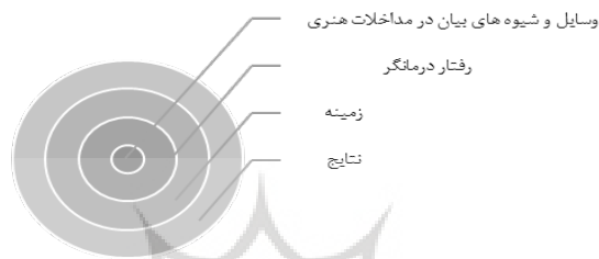
شکل ۲ الگوی گت و چهار لایه عملیاتی آن