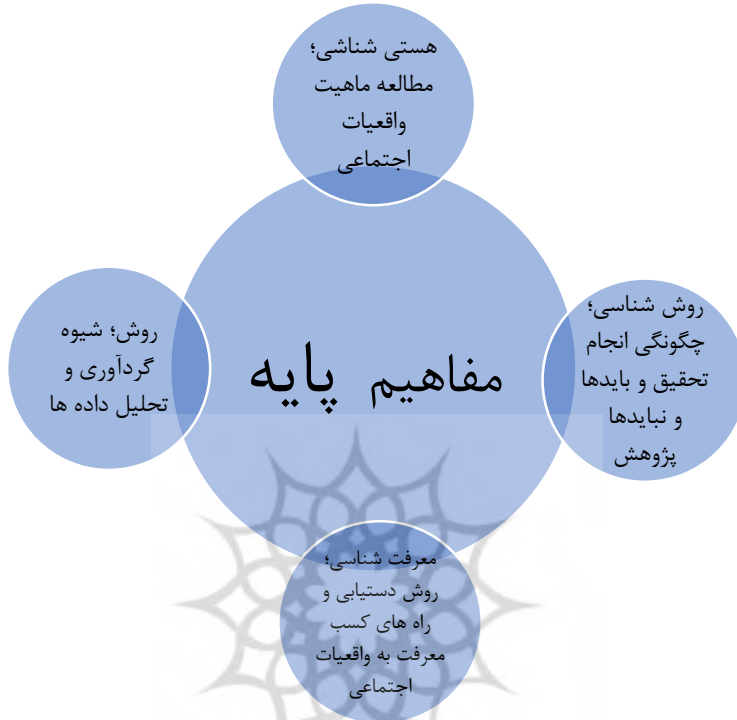
شکل ۱: مفاهیم پایه روش‌شناسی

تابع روش‌شناسی آن و روش‌شناسی نیز تابع منابع و مدارک معرفتی و منابع نیز تابع مسائل و موضوع علوم انسانی است (عبدلی مسینانی، ۱۳۹۹).