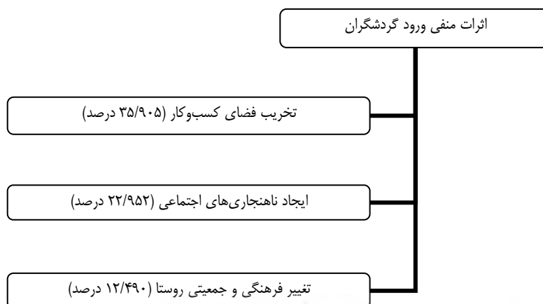
شکل ۳. مدل اثرات منفی ورود گردشگران به روستاهای دهستان ریجاب

عامل‌های مرتبط با اثرات منفی ورود گردشگران به روستاهای دهستان ریجاب در شکل ۳، نمایش داده شده‌اند.