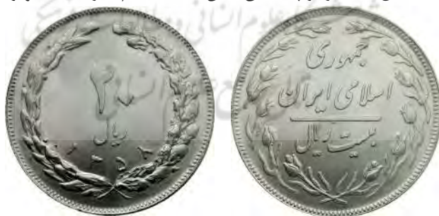
تصویر ۲. سکه بیست ریال جاری جمهوری اسلامی ایران؛ مضروب در سال ۱۳۵۸ ش ( https://en.numista.com/catalogue/pieces1692.html )

آنچه از این رهگذر برای ما حائز اهمیت بوده، به کارگیری شماری از مفاهیم اعتقادی و مبانی فکری انقلاب اسلامی در طراحی مسکوک مورد نظر است. اصولاً نقوش طرف روی سکه بیست ریال یادبودی یکهزار و چهارصدمین سال هجرت، فاقد هرگونه نکته خاص و برجسته‌ای می‌باشد (بنگرید به تصویر ۱)؛ زیرا نقر عنوان «جمهوری اسلامی ایران»، «ارزش اسمی» (۲۰ ریال) و «حلقه گیاهی» یا اصطلاحاً «تاج گل» (متشکل از دو شاخه اتصال یافته به یکدیگر) بر آن، هیچ تمایز ویژه و معناداری میان این مسکوک مناسبتی و دیگر سکه‌های بیست ریال (گونه‌های غیر یادبودی) وقت ایران ایجاد نمی‌نماید؛ چنانکه همین نقوش، بر مسکوک بیست ریال جاری مضروب در سال ۱۳۵۸ ش نیز دیده می‌شود؛ لیکن بخشی از این مندرجات، بر یک طرف و الباقی، بر سوی دیگرش حک گردیده و همچنین حلقه‌ای متشکل از دوازده شاخه گل لاله نیز بر پشت آن نقش بسته است (بنگرید به تصویر ۲).