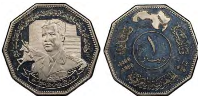
تصویر ۳. سکه یک دینار یادبودی جمهوری عراق به مناسبت نخستین سالگرد آغاز ریاست جمهوری صدام حسین (https://www.sarc.auction/IRAQ-Republic-1-dinar-1980-AH1400-PCGS-Proof-64-)