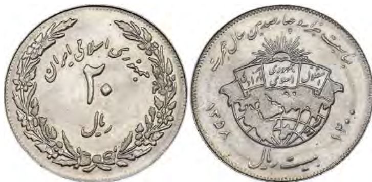
تصویر ۱. سکه بیست ریال یادبودی جمهوری اسلامی ایران به مناسبت حلول یکهزار و چهارصدمین سال هجرت

آنچه از این رهگذر برای ما حائز اهمیت بوده، به کارگیری شماری از مفاهیم اعتقادی و مبانی فکری انقلاب اسلامی در طراحی مسکوک مورد نظر است. اصولاً نقوش طرف روی سکه بیست ریال یادبودی یکهزار و چهارصدمین سال هجرت، فاقد هرگونه نکته خاص و برجسته‌ای می‌باشد (بنگرید به تصویر ۱)؛ زیرا نقر عنوان «جمهوری اسلامی ایران»، «ارزش اسمی» (۲۰ ریال) و «حلقه گیاهی» یا اصطلاحاً «تاج گل» (متشکل از دو شاخه اتصال یافته به یکدیگر) بر آن، هیچ تمایز ویژه و معناداری میان این مسکوک مناسبتی و دیگر سکه‌های بیست ریال (گونه‌های غیر یادبودی) وقت ایران ایجاد نمی‌نماید؛ چنانکه همین نقوش، بر مسکوک بیست ریال جاری مضروب در سال ۱۳۵۸ ش نیز دیده می‌شود؛ لیکن بخشی از این مندرجات، بر یک طرف و الباقی، بر سوی دیگرش حک گردیده و همچنین حلقه‌ای متشکل از دوازده شاخه گل لاله نیز بر پشت آن نقش بسته است (بنگرید به تصویر ۲).