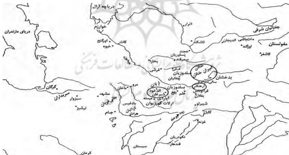
شکل ۱- نقشه جغرافیایی الوس جغتای و محل زندگی اپاردیان (منز، ۱۳۸۹، ص. ۴۵)