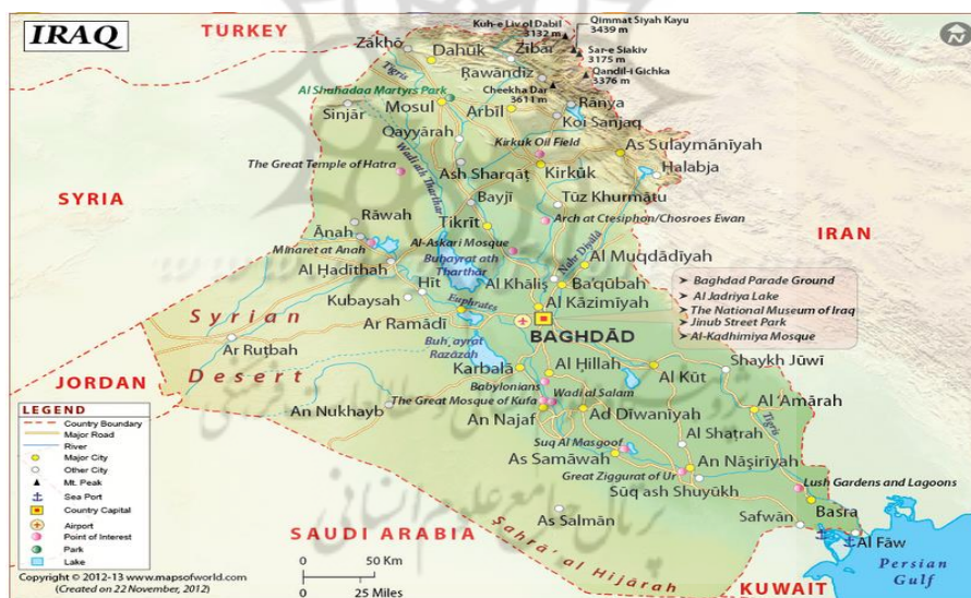
شکل ۱. موقعیت ژئوپلیتیکی عراق در خاورمیانه

عراق در سال ۱۹۲۱ به‌عنوان یک دولت مدرن پدیدار شد و همانند بسیاری از کشورها در جست‌وجوی ملت خاص خویش بود. در واقع عراق فراورده یک ملت نبود که برای تأسیس یک کشور بکوشد. هرچند تا کنون تلاش‌های زیادی برای ایجاد پیوند اجتماعی محکم میان مردم ساکن این کشور صورت گرفته است، اما هنوز هم بسیاری از صاحب‌نظران معتقدند که از مردمی تحت عنوان ملت عراق نمی‌توان سخن گفت (نیری و انصاری، ۱۳۹۱: ۱۶۷). در عین حال کشور عراق در منطقه راهبردی خاورمیانه قرار دارد و با شش کشور نظیر ایران از شرق، ترکیه از شمال، سوریه و اردن از غرب و عربستان سعودی و کویت از جنوب مرز مشترک دارد (شکل ۱). این کشور دارای ذخایر عظیم نفت و گاز فراوان است و پس از عربستان سعودی یکی از کشورهای مهم صادرکننده نفت و همچنین یکی از اعضای مهم اوپک به شمار می‌آید (یزدان‌پناه و عیسی‌نژاد، ۱۳۹۲: ۳).