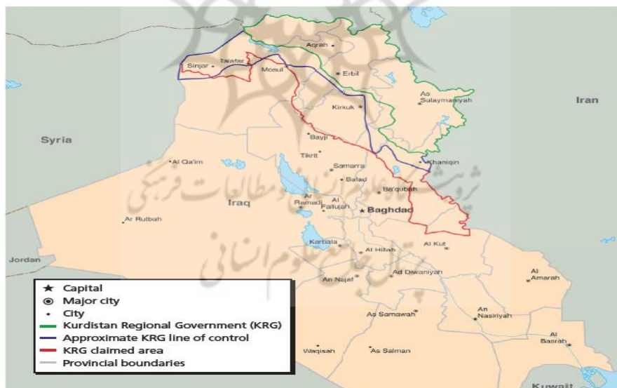
شکل ۲. شمای کلی موقعیت کردها در عراق

وسعت جغرافیایی موقعیت استان‌های کردنشین به این شرح است: وسعت استان اربیل ۱۴,۴۷۱ کیلومترمربع و جمعیت آن ۱,۳۴۵,۱۶۶ نفر، وسعت استان دهوک ۶,۵۵۳ کیلومترمربع و جمعیت آن ۴۱۱,۶۰۹ نفر و وسعت استان سلیمانیه ۱۷,۰۲۳ کیلومترمربع و جمعیت آن ۱,۶۵۹,۸۶۳ نفر است. از نظر منابع نفتی نیز حدود ۴۵ میلیارد بشکه نفت در این مناطق وجود دارد. همچنین به لحاظ سیاسی با قرار گرفتن بین چهار کشور ایران، ترکیه، سوریه و عراق و تأثیرگذاری متقابل بر سیاست‌های داخلی و منطقه‌ای این کشورها از اهمیت ویژه‌ای برخوردار است. به لحاظ اقتصادی، شمال عراق با قرار گرفتن بر سر راه خطوط لوله نفت صادراتی عراق به ترکیه و اروپا، شهرک‌های اقتصادی عراق را تحت تأثیر قرار داده و موقعیت راهبردی خود را نیز افزایش داده است. کردها از لحاظ فرهنگی و زبانی و طرز پوشش با عرب‌ها متفاوت‌اند. کردها زبان مخصوص به خود را دارند و مذهب اغلب آن‌ها سنی است. در مجموع ۷۵ درصد کردها سنی و ۱۵ درصد نیز شیعه و مابقی از سایر اقلیت‌ها هستند (نصری و رضایی، ۱۳۹۲: ۳۶). با عنایت به موقعیت ژئوپلیتیکی کردها در عراق و نیز تحلیل صورت‌بندی ظهور جنبش پان‌کردیسم در قالب یک پارادایم نظری، توجه به عوامل و مؤلفه‌های زیر ضرورتی اجتناب‌ناپذیر است.