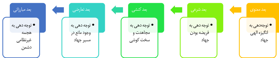
شکل ۲: ابعاد تحلیل جهاد انگاری الزامات تمدن سازی