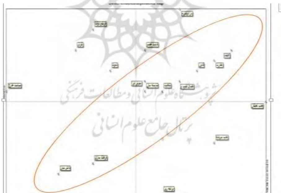
تصویر ۱. وضعیت پایداری/ناپایداری آینده خصوصی سازی در ایران

پراکنش متغیرها روی پلان اثرگذاری - اثرپذیری نشان دهنده ویژگی کلی سیستم است. در سیستم های ناپایدار تعداد متغیرهایی که هم اثرگذارند و هم اثرپذیر، تحولات شدیدی در آینده بر روی سیستم خواهند داشت و وضعیت کنونی آن پایدار نخواهد ماند. در این حالت شکل پراکنش متغیرها به صورت لوزی شکل از جنوب غربی به شمال شرقی نمودار خواهد بود. اما چنانچه سیستم دارای تعداد زیادی متغیر اثرگذار و در سمت مقابل تعداد زیادی متغیر اثرپذیر باشد و پراکنش متغیرها به صورت شکل L از سمت چپ نمودار ظاهر شود، سیستم پایدار است و شرایط کنونی سیستم در آینده زیاد تغییر نخواهد کرد. همان طور که از نمودار پژوهش حاضر قابل مشاهده می باشد پراکندگی عوامل نشان دهنده پایداری سیستم حاضر می باشد.