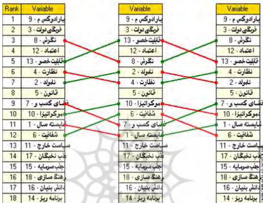
تصویر ۴. رتبه بندی عوامل بر اساس میزان تاثیرگذاری پیشران‌ها

بر اساس داده‌های برآمده از جدول شماره ۶ مهم‌ترین پیشران‌های موفقیت خصوصی سازی در آینده جمهوری اسلامی مشخص گردیدند. غالب نظریاتی (نظریه استبدادشرفی، نظریه پاتریمونیا لیس، نظریه دولت مطلقه، نظریه دولت رانتیر) که در پی تبیین ماهیت دولت در ایران بوده‌اند همواره بر بزرگ بودن اندازه دولت و سازو برگ‌های اقتصادی، سیاسی و ایدئولوژیکش تاکید کرده‌اند. این نظریات با اشاره به ریشه‌های تاریخی این فریگی؛ برماهیت مستقل و فراطبقاتی دولت در ایران از بابت خاستگاه و ماهیت و همچنین عملکرد و تفاوت آن با جوامع اروپایی اشاره کرده‌اند که این خصیصه در تاریخ معاصر ایران به دلیل ورود عنصری به نام درآمدهای نفتی تشدید شده است. از طرف دیگر؛ بواسطه روندهای تاریخی مسیر توسعه، بخش نامولد اقتصاد همواره جزء مهمی در ساختار اقتصاد سیاسی قدرت در ایران بوده است. این بخش بدون ایجاد