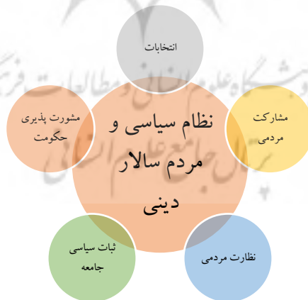
شکل ۱- شاخص‌های نظام سیاسی مردم‌سالاری دنیا

بسیار اساسی و تعیین کننده دارد. مردم در رکن سیاسی جامعه با نقش آفرینی در انتخاب مسئولین و همچنین رد یا تأیید تصمیمات کلان همچون قانون اساسی با حضور در انتخابات، در اداره کشور مشارکت دارند. از دیگر نقش آفرینی‌های مردم در عرصه سیاست، حضور در راهپیمایی‌ها و تظاهرات است که چهره سیاسی مطلوبی از کشور در دنیا ترسیم می‌کند. در رکن اجتماعی جامعه، مردم به‌عنوان کمک‌رسان و در قالب گروه‌ها و تشکل‌های مردمی، به حاکمیت و سایر مردم در حل مشکلاتشان کمک می‌کنند. نقش دیگر مردم در رکن اجتماعی جامعه به‌عنوان ناظر است؛ نظارت مردم بر نهادهای حاکمیتی و دولتی جهت بهبود خدمت‌رسانی، نظارت مردم بر بنگاه‌های اقتصادی جهت جلوگیری از فساد و گران‌فروشی، نظارت مردم بر مردم که در اسلام تحت عنوان امر به معروف و نهی از منکر مطرح می‌شود، از جمله مصادیق حضور و مشارکت مردم در رکن اجتماعی جامعه است که جایگزین دیگری ندارد. در رکن فرهنگی جامعه، مردم به‌عنوان مروج فرهنگ ایرانی و اسلامی می‌توانند مشارکت داشته باشند. در رکن اقتصادی جامعه نیز، حضور مردم می‌تواند به‌عنوان تولیدکننده، سرمایه‌گذار و مصرف‌کننده مؤثر واقع شود (شیرعلی، ۱۴۰۱). یکی از خواسته‌های مردم، حضور و نقش مردم و آرای‌شان در مدیریت کشور است و چون مؤمن به اسلام‌اند، پس مطلوب آنان نظام مردم‌سالاری اسلامی است؛ یعنی حاکمان با رأی مردم انتخاب شوند و ارزش‌ها و اصول حاکم بر جامعه اصول مبتنی بر شریعت اسلامی باشد (کاویانی و دیگران، ۱۴۰۱).