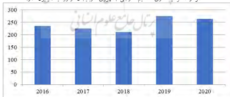
نمودار ۲: سرمایه‌گذاری مستقیم خارجی جمهوری آذربایجان در روسیه (میلیون دلار)