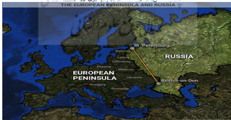
شکل شماره ۱: خط آسیب‌پذیری روسیه

تیم مارشال مدعی است که باید از دشواری‌های بزرگ دسترسی به دریاهای آزاد یاد کنیم. در صورت بروز جنگ، نیروی دریایی روسیه به دلیل وجود تنگه اسکاگراک در مسیر دریای شمال، نمی‌تواند از دریای بالتیک خارج شود و سواستوپول در کریمه که تنها بندر گرم روسیه است، در پانصد سال گذشته بارها از سمت غرب مورد هجوم واقع شده است. در سال ۱۶۰۵ لهستانی‌ها، در ۱۷۰۸ سوئدی‌ها، در ۱۸۱۲ فرانسویان، آلمان در ۱۹۱۴ و ۱۹۴۱ به آن یورش برده‌اند. با در نظر گرفتن جنگ کریمه ۱۸۵۳-۱۸۵۶ و دو جنگ جهانی، روس‌ها در هر ۳۳ سال یک‌بار در جلگه اروپای شمالی و اطرافش جنگیده‌اند (Marshal, 2020: 18). نقشه زیر آسیب‌پذیری‌های جغرافیایی روسیه را، در دشت‌های باز به روی اروپا و ناتو از سن پترزبورگ در کنار دریای بالتیک تا روستف در کنار دریای آرف نشان می‌دهد.