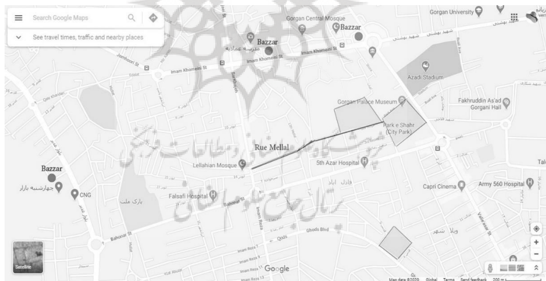
Fig 1- Localisation des jardins par rapport au marché

Les lieux que l’écrivain mentionne dans le livre, subissent des changements perpétuels. Même dans la carte géographique de Gorgân contemporain, nous trouvons le jardin de l’ambassade de Russie qui était jadis le jardin du palais et le jardin de trou qui s’appelait déjà jardin de prunes (carte 1).