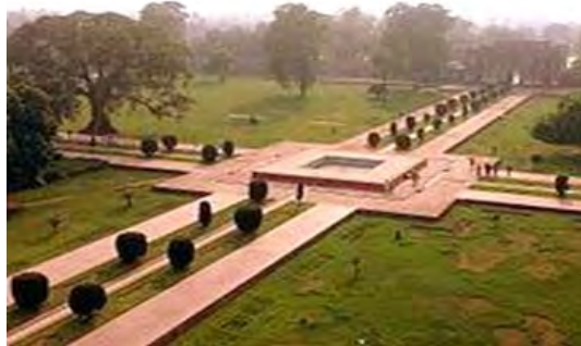
تصویر ۵- چهارباغ https://en.wikipedia.org/wiki/Charbagh

در هند، باغ‌های ایرانی در بستری از فرهنگ و اقلیم با تغییر رویکرد زندگی از سبک چادرنشینی به استقرار دائم شکل گرفت. تمایل ذاتی سلاطین مغول برای زندگی کوچ‌نشینی در طبیعت و نیز روحیات آنان به‌عنوان یک سرباز جنگجو باعث می‌شد زندگی در چهارباغ را به گذراندن اوقات در یک قصر محدود و سر بسته ترجیح دهند. بابر در کابل به دلیل فصل سرد و سخت زمستان اجباراً در قصر اقامت می‌گزید و سپس با آمدن بهار، به تبعیت از سبک زندگی آسیای میانه، در اردوهای خود و چراگاه‌ها و باغ‌های اطراف شهر روزگار می‌گذراند (موسوی‌حاجی و همکاران، ۱۳۹۳: ۱۶۱). بابر به معماری و ساخت بناهای زیبا نیز علاقه‌مند بود و هنگامی که در کابل بود، دستور ساخت چهارباغی را به سبک چهارباغ هرات صادر کرد. این چهارباغ به وسیله چهار خیابان از هم جدا می‌شدند و هر باغ با نهرهای پرآب به باغچه‌های کوچک‌تر تقسیم می‌شد. در کنار چهارباغ، معمولاً بازارچه و مدرسه ساخته می‌شد و مکانی برای اطراق و سفرهای چندروزه پادشاهان و حاکمان محلی در نظر گرفته شده بود که همگی تقلیدی از معماری ایران بود و این سبک معماری چهارباغ در هند بیشتر از ایران به کار رفته است. همچنین بناهای دیگری چون حمام نیز در آنجا ساخته می‌شد. علامی در اکبرنامه از چهارباغ‌های کابل و قندهار سخن گفته است. در بیشتر آرامگاه‌های شاهان مغولی هند از طرح چهارباغ نیز استفاده شده است (علامی، ۱۳۷۲: ۳۴۳ و ۳۵۱).