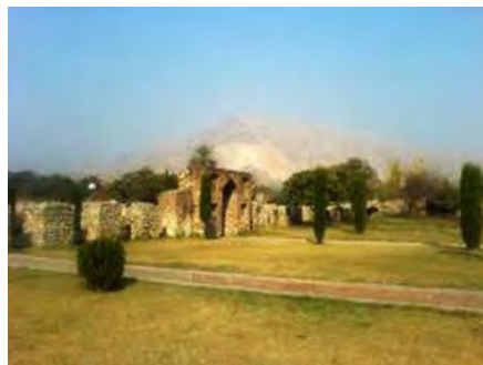
تصویر ۶- باغ وفا در آدینه‌پور کابل https://www.gardensvisit.com/gardens/bagh-e_vafa-wafa

طرح چهارباغ مجموعه باغ‌های بابر در حقیقت براساس طرح چهارباغ بهشت است که در قرآن مفهوم چهارباغ ذکر شده است: «و برای کسی که از مقام پروردگارش بترسد، دو باغ بهشتی است، پس کدام یک از نعمت‌های پروردگارتان را انکار می‌کنید» (سوره الرحمن، آیه ۴۶). «و در کنار آن دو بهشت، دو بهشت دیگر است، پس کدام یک از نعمت‌های پروردگارتان را انکار می‌کنید» (سوره الرحمن، آیه ۶۲). وسط باغ مزین به استخر بزرگ و چهارگوش است که به طرف چهار گوشه باغ آبراه دارد و در زمین مربع شکل مابین آبراه‌ها، درختان برای سرسبزی و زیبایی و اعتدال هوا کاشته شده‌اند (Cornell, 2007: 94). نام باغ‌هایی که بابر در هند ساخت، نشان می‌دهد که کابلی باغ، چهارباغ، باغ نیلوفر، باغ زرافشان، هشت بهشت و باغ وفا، متأثر از معماری ایران است، با خیابان‌ها و طرح‌ریزی‌هایی که توسط بابر به هند انتقال یافته بود. باغ وفا اولین باغ ساخته شده توسط بابر بود و در آن نهری جریان داشت و درختان پرتقال، لیمو و انار در آن کاشته شده بود. بابر میوه‌های هندی را به کابل نیز انتقال داد و نیشکر از هند به باغ وفا در آدینه‌پور (جلال‌آباد امروز و مرکز ایالت ننگرهار) آورد. بابر ذوقی را که در عمران و آبادسازی داشت در مدت کوتاه زندگی خود در هند به کار برد، باین حال چون پیش از بابر هنر بازسازی و تعمیر بنا در هند، سوابق درخشانی داشت و هم بابر در سمرقند و هرات نمونه‌هایی ارزنده از معماری را دیده بود یا تقلید می‌کرد، دوره بابر را در هند، دوام همان سبک معماری دوره‌های خلیجیان و لودیان افغانی گفته‌اند که نمایندگی سبک مخلوط اسلامی و هندی را بیان می‌کند (حبیبی، ۱۳۵۱: ۱۱۶).