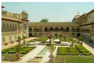
تصویر ۸- رام باغ در آگرا

https://en.wikipedia.org/wiki/Hasht_Behesht