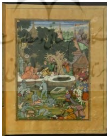
تصویر ۳- ملاقات بابرشاه با گورکاتری (رهبر یکی از طریقت‌های هندو)، بابرنامه، ۱۵۹۰م، آبرنگ، موزه هنر آسیا، سانفرانسیسکو

به نظر می‌رسد نخستین اقدام بابر برای نگارگری و تأسیس سبک بابری به‌وسیله نقاشانی به‌وجود آمد که پس از استقرار بابر در کابل، از بخارا به این شهر آمدند و نیز پس از استقرار در هند، از کابل به این شهر رفتند (دیماند، ۱۳۸۳: ۶۹). می‌توان گفت در دوره بابر، به‌دلیل مشکلات و جنگ‌های طولانی برای تداوم حکومت و گشایش شهرها، بابر موفق به ایجاد و تأسیس کارگاه‌های نقاشی و تجمع هنر و هنرمندان نشد و شاید به‌همین دلیل است که اطلاعات دقیقی از هنر و آثار نقاشی دوره بابر موجود نیست (خواندمیر، ۱۳۶۲: ۹-۱۰). صحنه‌های نبرد، محاصره قلعه‌ها، شکار و همچنین صحنه‌هایی از ملاقات‌های شاه، جشن و پذیرایی در دربار پادشاهان و شاهزادگان نیز به فراوانی مشاهده می‌شود. تصویر ۳ ملاقات بابر با افرادی از طریقت هندو را در معبد نشان می‌دهد، بنابراین بابر پادشاهی جزم‌اندیش و متعصب نبوده است.