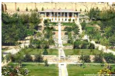
تصویر ۷- باغ هشت بهشت در کابل

طرح چهارباغ مجموعه باغ‌های بابر در حقیقت براساس طرح چهارباغ بهشت است که در قرآن مفهوم چهارباغ ذکر شده است: «و برای کسی که از مقام پروردگارش بترسد، دو باغ بهشتی است، پس کدام یک از نعمت‌های پروردگارتان را انکار می‌کنید» (سوره الرحمن، آیه ۴۶). «و در کنار آن دو بهشت، دو بهشت دیگر است، پس کدام یک از نعمت‌های پروردگارتان را انکار می‌کنید» (سوره الرحمن، آیه ۶۲). وسط باغ مزین به استخر بزرگ و چهارگوش است که به طرف چهار گوشه باغ آبراه دارد و در زمین مربع شکل مابین آبراه‌ها، درختان برای سرسبزی و زیبایی و اعتدال هوا کاشته شده‌اند (Cornell, 2007: 94). نام باغ‌هایی که بابر در هند ساخت، نشان می‌دهد که کابلی باغ، چهارباغ، باغ نیلوفر، باغ زرافشان، هشت بهشت و باغ وفا، متأثر از معماری ایران است، با خیابان‌ها و طرح‌ریزی‌هایی که توسط بابر به هند انتقال یافته بود. باغ وفا اولین باغ ساخته شده توسط بابر بود و در آن نهری جریان داشت و درختان پرتقال، لیمو و انار در آن کاشته شده بود. بابر میوه‌های هندی را به کابل نیز انتقال داد و نیشکر از هند به باغ وفا در آدینه‌پور (جلال‌آباد امروز و مرکز ایالت ننگرهار) آورد. بابر ذوقی را که در عمران و آبادسازی داشت در مدت کوتاه زندگی خود در هند به کار برد، باین حال چون پیش از بابر هنر بازسازی و تعمیر بنا در هند، سوابق درخشانی داشت و هم بابر در سمرقند و هرات نمونه‌هایی ارزنده از معماری را دیده بود یا تقلید می‌کرد، دوره بابر را در هند، دوام همان سبک معماری دوره‌های خلیجیان و لودیان افغانی گفته‌اند که نمایندگی سبک مخلوط اسلامی و هندی را بیان می‌کند (حبیبی، ۱۳۵۱: ۱۱۶).