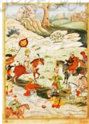
تصویر ۱- ملاقات بابرشاه با سلطان علی میرزا، بابرنامه، ۱۵۹۰م، موزه هنر متروپولیتن، نیویورک

http://www.metmuseum.org/art/collection/search/451958