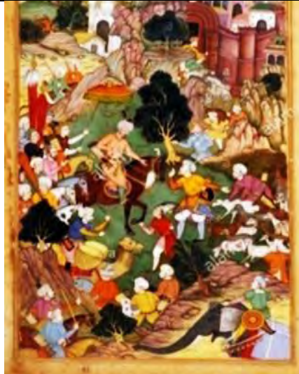
تصویر ۲- بابر در خانجا در نزدیکی کابل، موزه ملی هند، دهلی