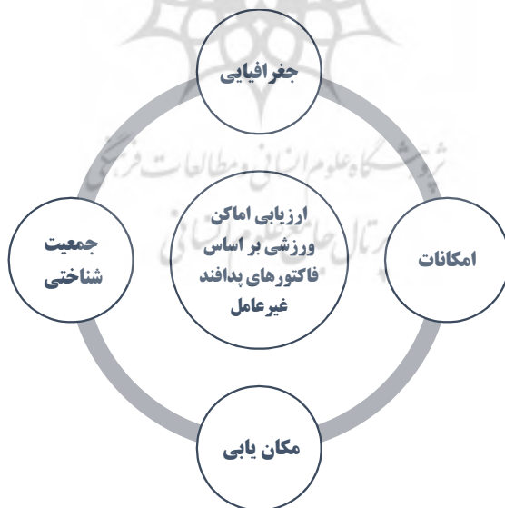
شکل ۱. مدل نهایی ارزیابی اماکن ورزشی شهر تبریز با توجه به عوامل پدافند غیرعامل

کدهای محوری پژوهش حاضر در واقع همان مقولات مستخرج شده در مرحله کدگذاری باز می‌باشند (کرسول، ۱۳۹۶). بنابراین مدل نهایی ارزیابی اماکن ورزشی شهر تبریز با توجه به عوامل پدافند غیرعامل در شکل ۱ نشان داده شده است: