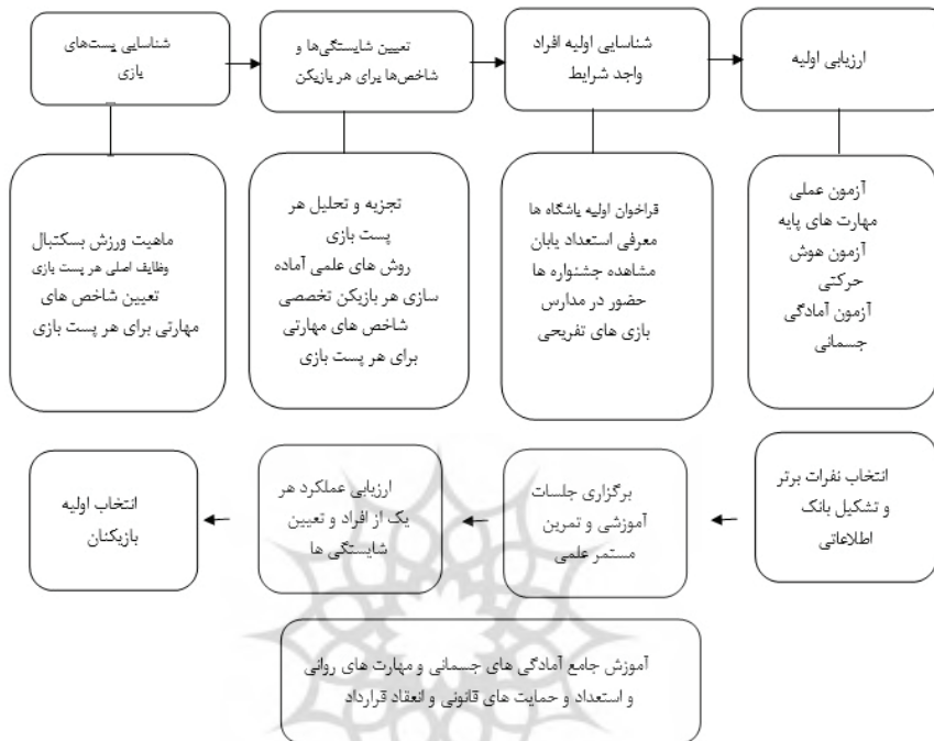
شکل ۱: گام های اجرایی برنامه ریزی باشگاه های بسکتبال برای پرورش بازیکن

شایسته و مؤثر را تجربه نکنند. فرایند مدیریتی برنامه ریزی شیوه پرورش بازیکن که در باشگاه های بسکتبال انجام می شود در شکل ۱ نشان داده شده است: