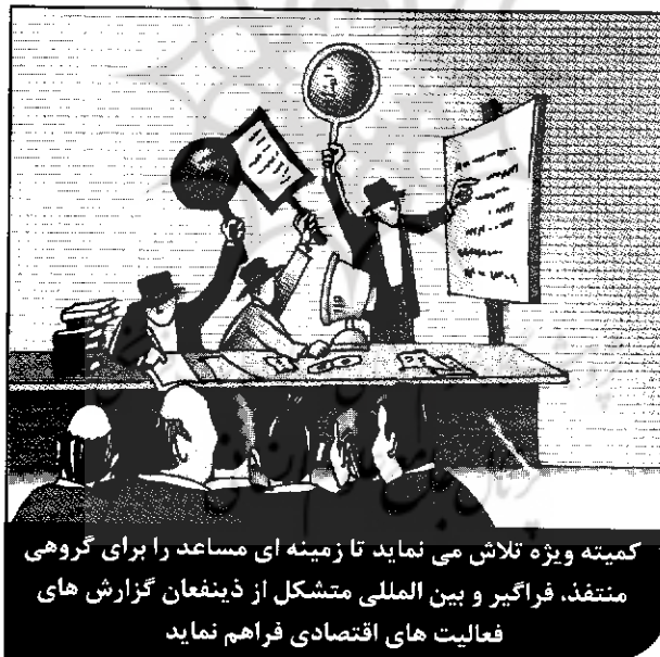
کمیته ویژه تلاش می‌نماید تا زمینه‌ای مساعد را برای گروهی منتفذ، فراگیر و بین‌المللی متشکل از ذینفعان گزارش‌های فعالیت‌های اقتصادی فراهم نماید

با مطرح شدن ذینفعان واقعی شامل افرادی که قدرت تقاضا و فراهم کردن اطلاعات بهتر را دارند، کمیته ویژه حرکت به سمت ارتقاء گزارشگری فعالیت‌های اقتصادی را با این ائتلاف جهانی تسریع خواهد نمود.