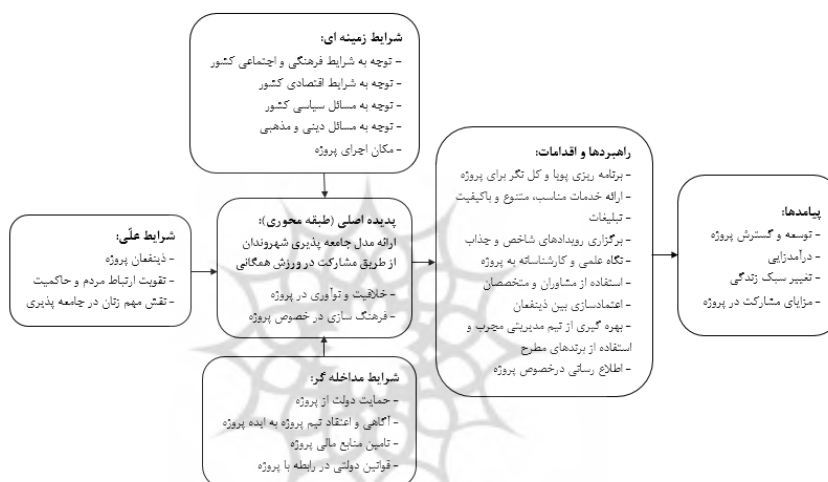
شکل ۲: مدل پارادایمی جامعه‌پذیری شهروندان از طریق مشارکت در ورزش همگانی

در مراحل بعد یعنی مرحله کدگذاری محوری و کدگذاری انتخابی (گزینه‌ی) بین مقولات ایجاد شده، رابطه شکل گرفت. اساس فرآیند ارتباط‌دهی در کدگذاری محوری، بر تمرکز و تعیین یک مقوله به عنوان مقوله محوری یا اصلی قرار داشت که این مقوله محوری همان هدف اصلی تحقیق می باشد. سپس سایر مقولات به عنوان مقولات فرعی به مقوله اصلی ارتباط داده شدند. پس از تعریف مقوله محوری، شرایط علی، شرایط زمینه‌ای، شرایط مداخله‌گر، راهبردها و اقدامات و پیامدهای ناشی از آنها تعریف شد. به این ترتیب با ایجاد یک آهنگ و چیدمان خاص بین مقوله‌ها، مدل شکل ۲ برای جامعه‌پذیری شهروندان از طریق مشارکت در ورزش همگانی تنظیم گردید: