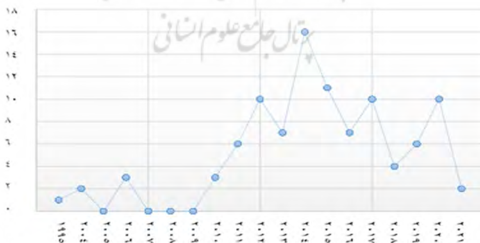
شکل ۱. روند سیر پژوهش‌های خصوصی‌سازی در ورزش ایران

پایان تابستان ۲۰۲۱ چگونه بوده است؟ نتایج در شکل ۱ و جدول ۶ در پاسخ به سؤال ۴ تحقیق که این بود: روند سیر پژوهش‌ها در حوزه خصوصی‌سازی ورزش ایران و انتشار (داخلی و خارجی پژوهش‌ها) تا نشان داده شده است.