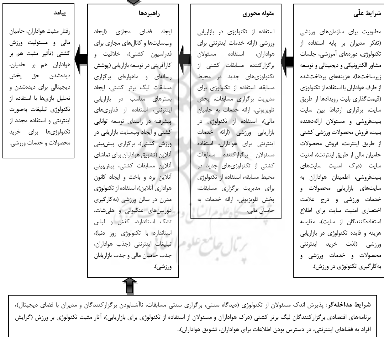
شکل ۱. تأثیر محیط تکنولوژی بر توسعه بازاریابی در لیگ برتر کشتی

شرایط زمینه‌ای: مطلوبیت درآمد ورزش کشتی از طریق تکنولوژی (پخش تلویزیونی و ماهواره‌ای، همکاری و ارائه خدمات الکترونیکی مشترکین (ایرانسل، همراه اول و رایتل)، افزایش نقدینگی از طریق فضای مجازی)، مطلوبیت درآمد از طریق بازاریابی (افزایش متخصصان بازاریاب، آگاهی از نحوه بازاریابی، استفاده از تبلیغات بلبوردی در سطح شهر و تبلیغات از طریق فضای مجازی)، سود حاصل از تکنولوژی (سرعت پهنای باند، ارائه اینترنت در کل کشور سودآور بودن استفاده از تکنولوژی‌های مدرن، افزایش خرید محصولات و خدمات ورزشی و افزایش مشارکت).