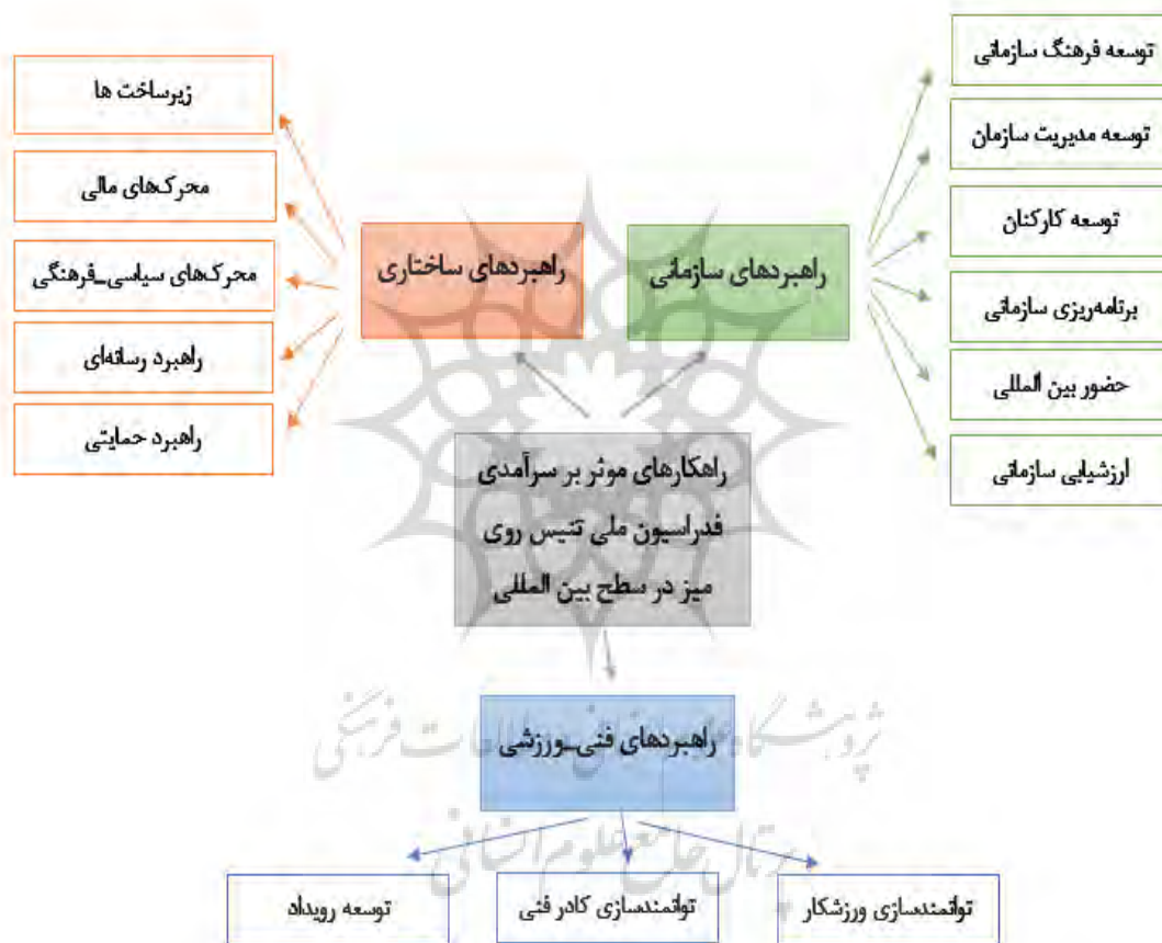
شکل ۲. نقشه مفهومی مضامین شناسایی شده

نتایج در جدول ۳ نشان می‌دهد که از تجزیه و تحلیل داده‌های کیفی تعداد ۸۱ مقوله فرعی به‌دست آمده است که در ۱۴ مقوله اصلی قرار گرفته شد. درنهایت نیز از مقوله‌های به‌دست‌آمده، ۳ مفهوم اصلی راهبردهای سازمانی، راهبردهای ساختاری و راهبردهای فنی-ورزشی به‌دست آمد. در بخش راهبردهای سازمانی، مقوله‌های اصلی توسعه فرهنگ سازمانی (۷ مقوله فرعی)، توسعه مدیریت سازمان (۸ مقوله فرعی)، توسعه کارکنان (۱۵ مقوله فرعی)، برنامه‌ریزی سازمانی (۵ مقوله فرعی)، حضور بین‌المللی (۳ مقوله فرعی) و ارزشیابی