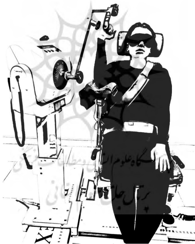
شکل ۱- آزمون حس وضعیت مفصل آرنج Figure 1- Elbow joint position sense test

همچنین در این پژوهش، از فرم بررسی دستکاری به منظور ارزیابی و بررسی اعمال و پیاده‌سازی صحیح مداخله استفاده گردید. فرم