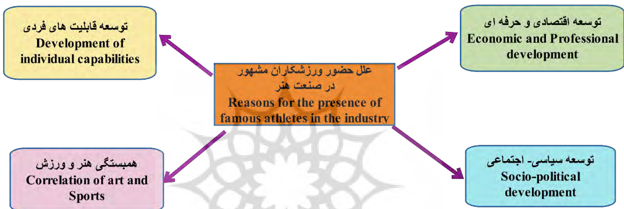
شکل ۱- علل حضور ورزشکاران مشهور در عرصه صنعت هنر