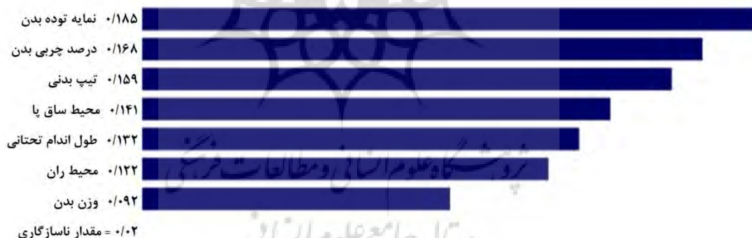
شکل ۵ - وزن زیرمعیارها در معیار شاخص‌های آنترپومتریکی برای استعدادیابی در فوتبال نابینایان

در بین شاخص‌های آنترپومتریکی، نمایه توده بدن با وزن (۰/۱۸۵) در اولویت اول قرار گرفت و پس از آن شاخص‌های درصد چربی بدن با وزن (۰/۱۶۸)، تیپ بدنی با وزن (۰/۱۵۹)، محیط ساق پا با وزن (۰/۱۴۱)، طول اندام تحتانی با وزن (۰/۱۳۲)، محیط ران با وزن (۰/۱۲۲) و وزن بدن با وزن (۰/۰۹۲) به ترتیب در اولویت‌های بعدی قرار گرفتند (شکل ۵).