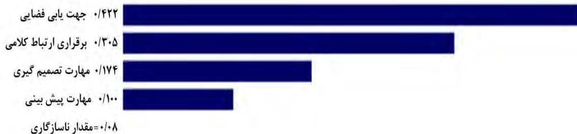
شکل ۲ - وزن زیرمعیارها در معیار مهارت‌های تاکتیکی برای استعدادیابی در فوتبال نابینایان

مهم‌ترین زیرمعیار در دسته مهارت‌های تکنیکی، مهارت دریبل زدن با وزن (۰/۴۰۰) بود و مهارت کنترل کردن توپ با یک تفاوت زیاد نسبت به مهارت دریبل زدن و با وزن (۰/۲۱۴) در رده دوم قرار گرفت. مهارت شوت زدن در حین حرکت با وزن (۰/۲۱۰) و مهارت پاس دادن با وزن (۰/۱۷۷) نیز به ترتیب در رتبه‌های بعدی قرار گرفتند (شکل ۳).