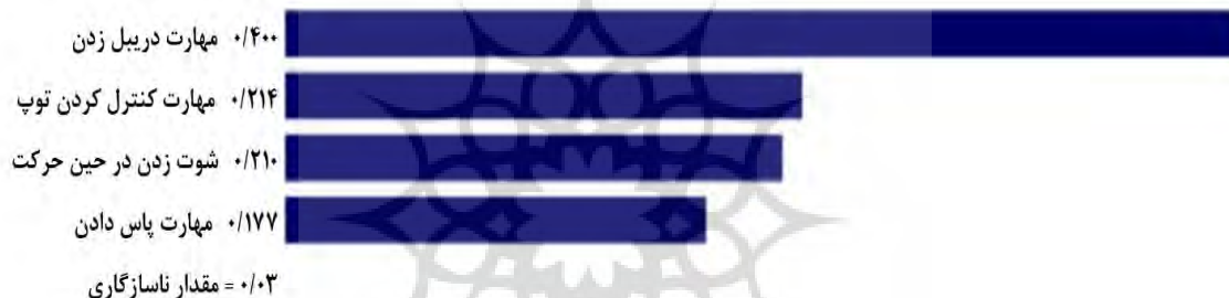
شکل ۳ - وزن زیرمعیارها در معیار مهارت‌های تکنیکی برای استعدادیابی در فوتبال نابینایان

مهم‌ترین زیرمعیار در دسته مهارت‌های تکنیکی، مهارت دریبل زدن با وزن (۰/۴۰۰) بود و مهارت کنترل کردن توپ با یک تفاوت زیاد نسبت به مهارت دریبل زدن و با وزن (۰/۲۱۴) در رده دوم قرار گرفت. مهارت شوت زدن در حین حرکت با وزن (۰/۲۱۰) و مهارت پاس دادن با وزن (۰/۱۷۷) نیز به ترتیب در رتبه‌های بعدی قرار گرفتند (شکل ۳).