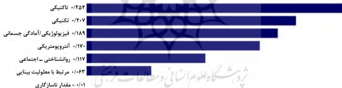
شکل ۱ - وزن معیارها برای استعدادیابی در فوتبال نابینایان

از ۱۵ متخصصی که از آنها درخواست شد تا به پرسشنامه روش تحلیل سلسله مراتبی پاسخ دهند، فقط ۷ نفر این پرسشنامه را تکمیل کردند. پاسخ‌ها با استفاده از نرم‌افزار اکسپرت چویس، نسخه ۱۱، مورد تحلیل قرار گرفت. بر اساس نتایج این مرحله، مهارت‌های تاکتیکی با وزن (۰/۲۵۴) به عنوان مهم‌ترین معیار انتخاب شدند و پس از آن مهارت‌های تکنیکی با وزن (۰/۲۰۷)، شاخص‌های فیزیولوژیکی / آمادگی جسمانی با وزن (۰/۱۸۹)، شاخص‌های آنترپومتری با وزن (۰/۱۷۰)، شاخص‌های روانشناسی - اجتماعی با وزن (۰/۱۱۷) و عوامل مرتبط با معلولیت بینایی با وزن (۰/۰۶۳) به ترتیب در اولویت‌های بعدی قرار گرفتند (شکل ۱).