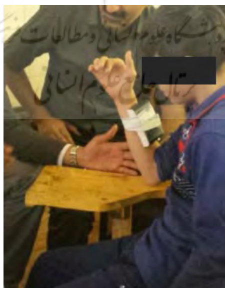
شکل ۲. اجرای تکلیف حس عمقی توسط شرکت کننده