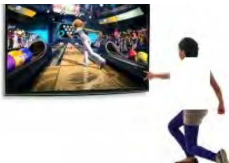
شکل ۳. تصویر شماتیک پرتاب بولینگ در بازی Xbox

به منظور انجام تمرینات واقعیت مجازی از دستگاه Xbox استفاده می‌شود. این دستگاه دارای رزولوشن تصویر 1920 \times 1080 ، و مجهز به ۵ پورت USB (Universal Serial Bus)، یک پورت مخصوص Kinect، خروجی‌های HDMI و AV، خروجی TOSLINK و همچنین شبکه بی‌سیم Wi-Fi بود.