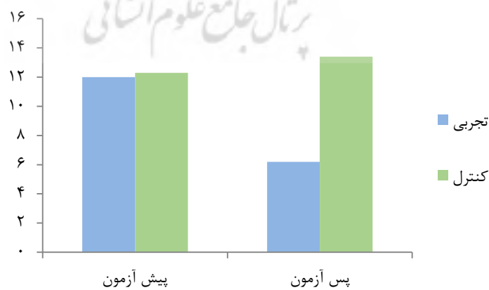
شکل ۴. میانگین نمرات مربوط به حس عمقی مفصل آرنج در مراحل پیش‌آزمون و پس‌آزمون گروه‌های پژوهش

بر اساس نتایج آزمون t مستقل، تفاوت معناداری در شاخص‌های دموگرافیک سن، قد و وزن کودکان فلج مغزی همی‌پلاژی در دو گروه تجربی و کنترل وجود نداشت.