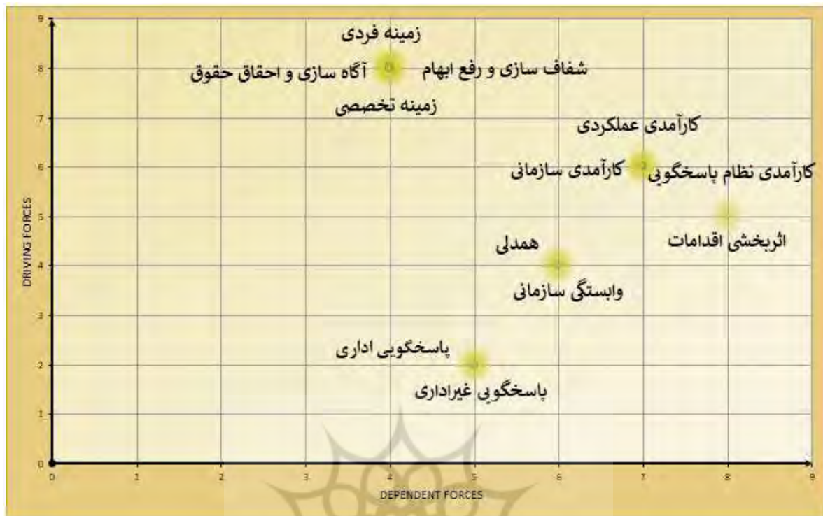
شکل ۲. میزان نفوذ و وابستگی عوامل مؤثر پاسخگویی مدیران سازمان های ورزشی

با استناد به نتایج تحلیل میک مک، زمینه فردی، شفاف سازی و رفع ابهام، آگاه سازی و احقاق حقوق و زمینه تخصصی جزء متغیرهای اثرگذار بر سیستم هستند. متغیرهای همدلی و وابستگی سازمانی، پاسخگویی اداری و پاسخگویی غیراداری جزء متغیرهای وابسته سیستم و در نهایت اثربخشی اقدامات، کارایی سازمانی، کارایی عملکردی و کارایی نظام پاسخگویی جزء متغیرهای پیوندی سیستم بودند.