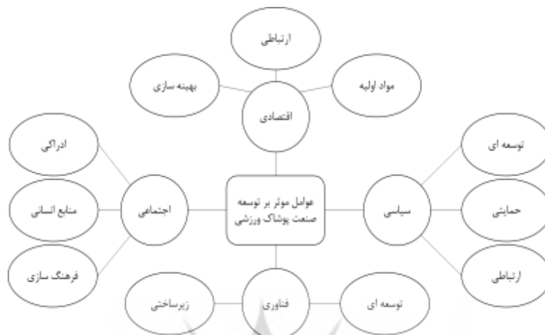
شکل ۱. شبکه مضامین توسعه صنعت پوشاک ورزشی

همان گونه که در جدول ۴ مشخص است، مقولات تم سیاسی به تم‌های فرعی حمایتی، توسعه‌ای و ارتباطی، مقولات تم اقتصادی به تم‌های فرعی مواد اولیه، ارتباطی و بهینه‌سازی، مقولات تم اجتماعی به تم‌های ادراکی، فرهنگ‌سازی و منابع انسانی و تم فناوری به تم‌های فرعی توسعه‌ای و زیرساختی طبقه‌بندی می‌شود. در ادامه، شبکه مضامین تحقیق در شکل ۱ نمایش داده شده است.