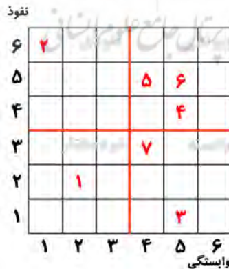
شکل ۱: نتیجه تحلیل میک

در جدول ۴، قدرت نفوذ و میزان وابستگی هر یک از راهبردها محاسبه شده است. به‌عنوان نمونه، قدرت نفوذ راهبرد «تقویت و ارتقای محیط قانونی، حقوقی و برنامه‌های فدراسیون موتورسواری و اتومبیلرانی»، ۶ - به این معنا که بر ۶ راهبرد تأثیر می‌گذارد - و میزان وابستگی آن ۱ است - یعنی ۱ راهبرد بر راهبرد «تقویت و ارتقای محیط قانونی، حقوقی و برنامه‌های فدراسیون موتورسواری و اتومبیلرانی» تأثیر می‌گذارد. این اعداد در طبقه‌بندی راهبردها استفاده می‌شوند اما قبل از آن باید تحلیل میک می‌ک انجام شود (شکل ۱).