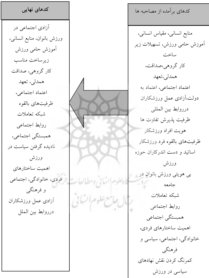
نمودار ۱. پالایش کدهای برآمده از مصاحبه با متخصصان و استخراج کدهای نهایی

پس از انجام مرحله اول و تحلیل محتوای مصاحبه ها، شاخص های موثر بر سرمایه اجتماعی در حوزه جامعه شناسی ورزش یا در اصطلاح «کدهای مکانی» از نگاه این ده متخصص استخراج شد. در نهایت ۲۱ کد، به عنوان کدهای مکانی موثر بر سرمایه اجتماعی در تعامل با بستر اجتماعی تعیین گردید. این فرایند در نمودار ۱ دیده می شود.