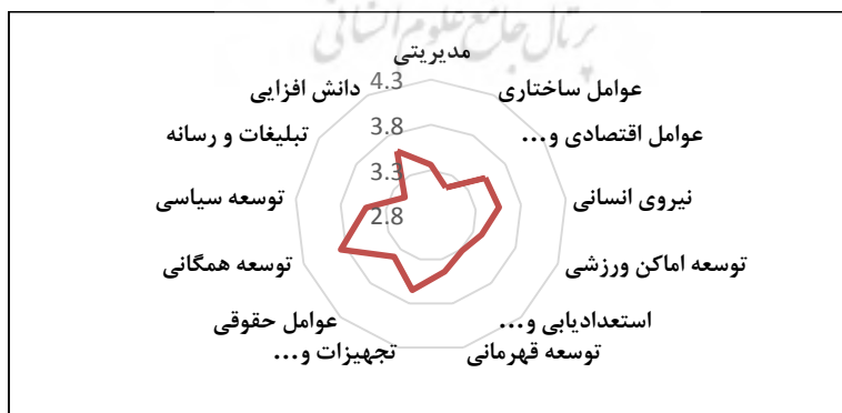
شکل ۲. مدل عوامل موثر بر توسعه انجمن های ورزش رزمی در ایران

همچنین با توجه به نتایج، الگوی عوامل موثر بر توسعه انجمن های ورزش رزمی در ایران بر اساس شکل ۲ به دست می آید. با توجه به این شکل، اولویت های مورد توجه برای توسعه انجمن های ورزش رزمی در ایران مشخص است. عوامل ساختاری و استعدادیابی به همراه تبلیغات و رسانه اولویت های مورد توجه در این شکل می باشند.