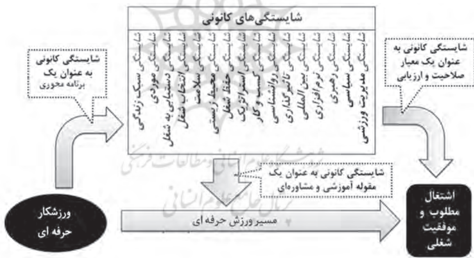
شکل ۲: مدل تفسیری پژوهش

در نهایت چارچوب و نتایج پژوهش را می‌توان به صورت کاربردی و سیستمی مانند شکل زیر مورد بررسی قرار داد. براساس شکل می‌توان گفت در مسیر ورزش حرفه‌ای، شایستگی‌های کانونی می‌توانند به عنوان یک برنامه محوری ورودی سیستم، همینطور در قالب یک فعالیت آموزشی و مشاوره‌ای در فرایند و به عنوان یک معیار صلاحیت و ارزیابی در فرایند خروجی که موجب اشتغال مطلوب و موفقیت شغلی گردد مورد توجه قرار بگیرد.